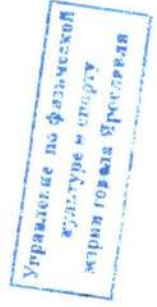
Раздел 2. Сведения о выплатах учреждения